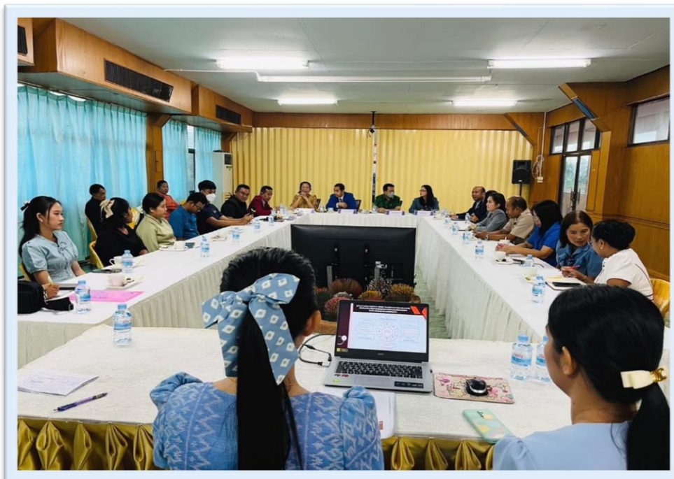
การนิเทศติดตามโครงการครูดีไม่มีอบายมุข เป็นการส่งเสริมเรื่องคุณธรรมจริยธรรมในสถานศึกษา