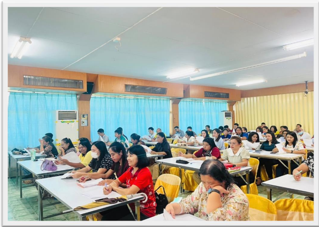
การประชุมประจำเดือนที่มีการเน้นย้ำเรื่องการขับเคลื่อนเรื่องจริยธรรมในหน่วยงาน