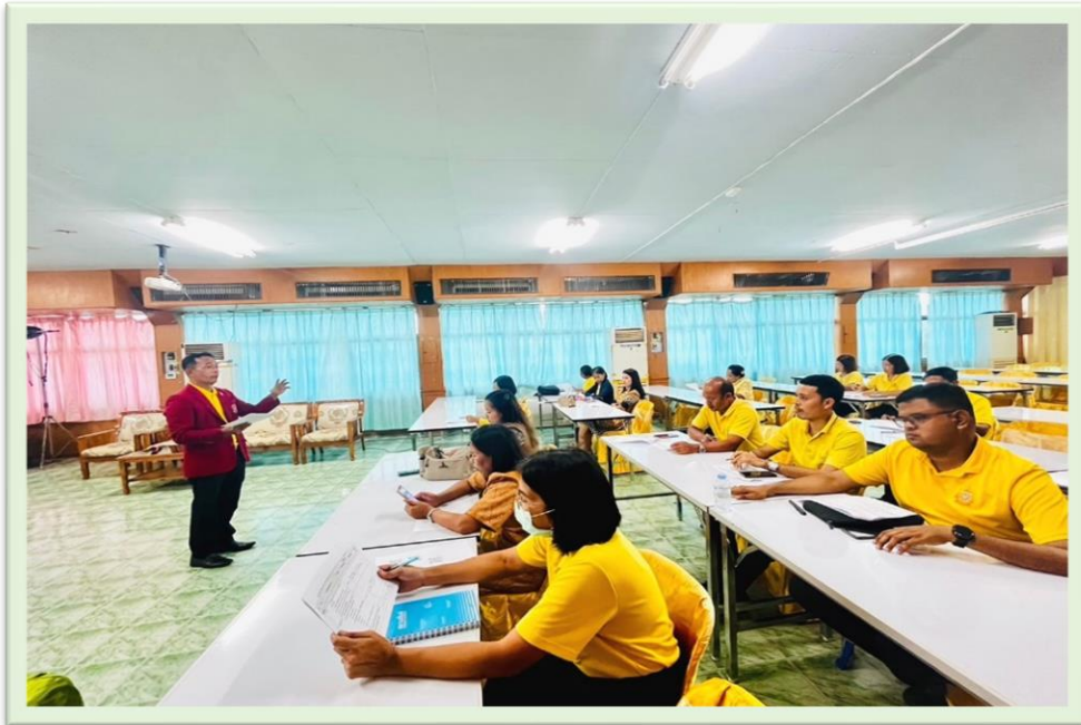
การประชุมครูผู้เกี่ยวข้องกับการขับเคลื่อนจริยธรรมของโรงเรียนเชียรใหญ่