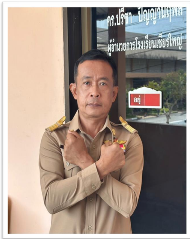
กิจกรรมการต่อต้านการทุจริตและประพฤติมิชอบและนโยบายไม่รับของขวัญ No Gift Policy